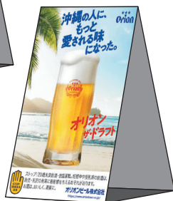
テーブルテント 10cm×14.8cm (片面サイズ)